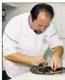
Gilles Goujon: «Meine Küche ist erfinderisch».

«L'Auberge de l'Il» im elsässischen Illhäusern und «L'Armsbourg» im lothringischen Baerenthal in der obersten Kategorie halten. Der Strasbourger Feinschmecker-