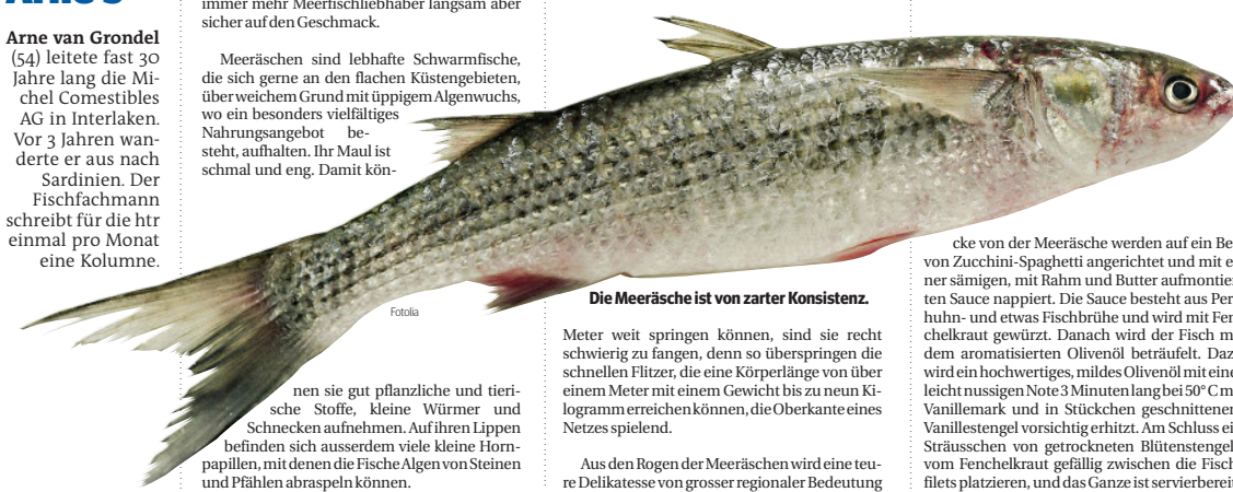
Die Meeräsche ist von zarter Konsistenz.

Als ganz besonderen Leckerbissen darf die Zubereitung einer Meeräsche mit einem – mit Vanillemark – aromatisierten Olivenöl bezeichnet werden. Die schön dicken gegarten Filetstücke