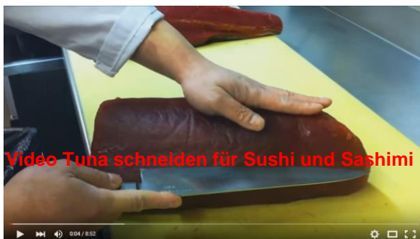
Video Tuna schneiden für Sushi und Sashimi